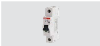
Leitungsschutzschalter B6 für DEHNshield ZP LSG