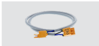
Anschlussleitung SMG APL für DEHNshield ZP

Zur Nachrüstung der Spannungs- versorgung des intelligenten Messsystems.