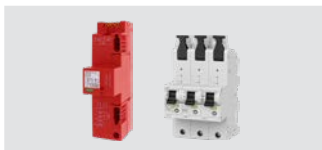
DEHNshield ZP B2 LSG TT 255 + SHU 35 A

Wählen Sie das passende Bundle, individuell zu Ihrem Anwendungsfall für Gebäude ohne äußeren Blitzschutz: