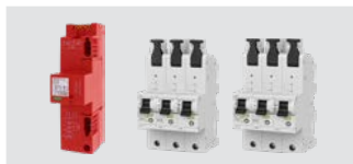
DEHNshield ZP B2 LSG TT 255 + 2x SHU 35 A

Optimal geeignet für die Installa- tion in Einfamilienhäusern.