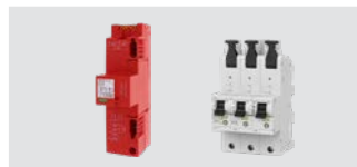
DEHNshield ZP B2 LSG TT 255 + SHU 50 A

Optimal geeignet für die Installa- tion in Mehrfamilienhäusern.